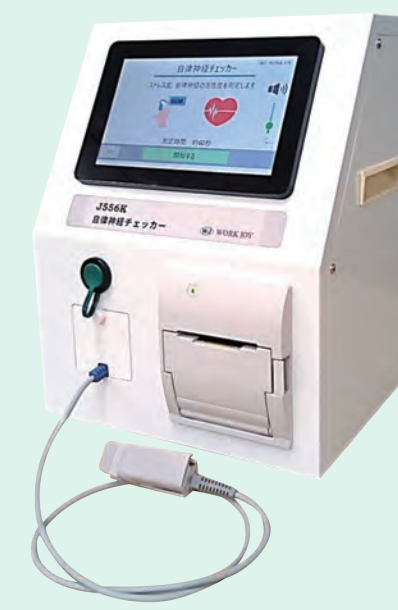
※自律神経チェッカー J556K