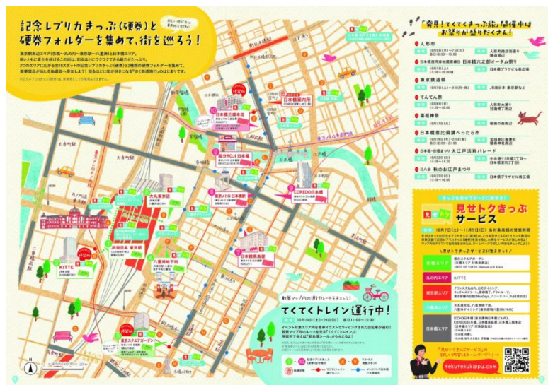
《散策対象エリア イメージ》

【STEP 2】散策対象エリア内の10スポットで「記念レプリカきっぷ(硬券)」を手に入れる。