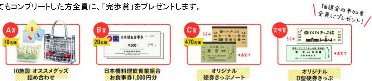
《抽選会賞品 イメージ》

散策対象エリア内の 10 スポット全ての記念レプリカきっぷを集めると、土・日・祝日に「日本橋案内所(COREDO 室町 地下 1 階)」で開催する『抽選会』にご参加いただけます。合計 500 名様に豪華賞品が当たるほか、抽選にはずれてもコンプリートした方全員に、「完歩賞」をプレゼントします。