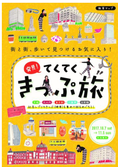
《散策マップ 表紙イメージ》

散策対象エリア内の10スポットでは、「発見！てくてくきっぷ旅」の遊び方やエリアの見どころ、グルメなどを紹介した『散策マップ』を配布します。