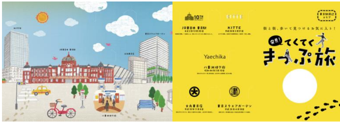
《東京駅周辺エリア散策用 イメージ》

散策対象エリア内の 2 スポットでは、集めた記念レプリカきっぷ(硬券)を収納できる『硬券フォルダー』を配布します。硬券フォルダーには、東京駅周辺エリア散策用と日本橋エリア散策用の 2 種類があり、それぞれ、「東京スクエアガーデン」と「日本橋三越本店」で配布します。