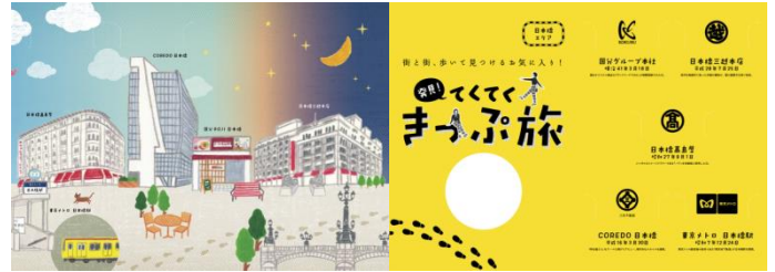
《日本橋エリア散策用 イメージ》