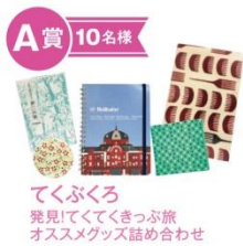
A 賞 10名様 てくてく 発見! てくてくきっぷ旅 オススメグッズ詰め合わせ

散策対象エリア内の 10 施設全ての記念レプリカきっぷ(硬券)と硬券フォルダーを集めると、土・日・祝日に「日本橋案内所(COREDO 室町 1・地下 1 階)」で開催する『抽選会』にご参加いただけます。記念レプリカきっぷ(硬券)をコンプリートした方全員に、「完歩賞」としてオリジナルチケットケースをプレゼントするほか、抽選で合計 670 名様に「発見! てくてくきっぷ旅 オススメグッズ詰め合わせ」や「お食事券」などの素敵な賞品が当たります。