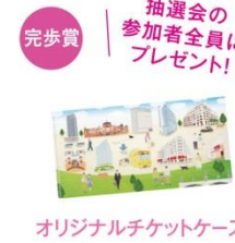
完歩賞 抽選会の 参加者全員に プレゼント!