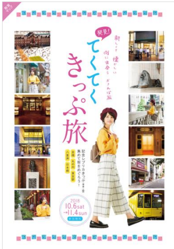
《散策マップ 表紙イメージ》

散策対象エリア内の 10 施設では、「発見！てくてくきっぷ旅」の遊び方やエリアの見どころ、グルメなどを紹介した『散策マップ』を配布します。