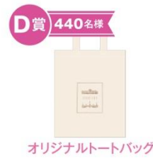
D 賞 440名様 オリジナルトートバッグ