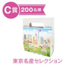
C 賞 200名様 東京名産セレクション