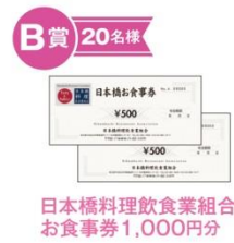
B 賞 20名様 日本橋お食事券 お食事券1,000円分