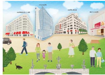
《日本橋エリア散策用 イメージ》