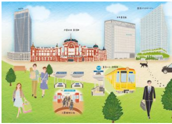
《東京駅周辺エリア散策用 イメージ》

散策対象エリア内の 2 施設(「東京駅周辺エリア」「日本橋エリア」各 1 施設)では、集めた記念レプリカきっぷ(硬券)を収納できる『硬券フォルダー』を配布します。硬券フォルダーには「東京駅周辺エリア」散策用と「日本橋エリア」散策用の 2 種類があり、それぞれ「東京スクエアガーデン」と「COREDO 日本橋」で配布します。