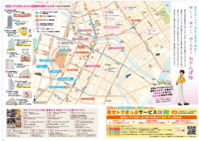
《散策対象エリア イメージ》

【STEP 2】散策対象エリア内の 10 施設を巡って「記念レプリカきっぷ(硬券)」を手に入れる。