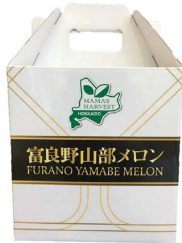
オリジナルギフトBOX ※別売り（料金は送料やロットにより異なります）